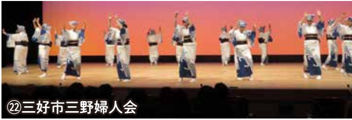
㉒三好市三野婦人会