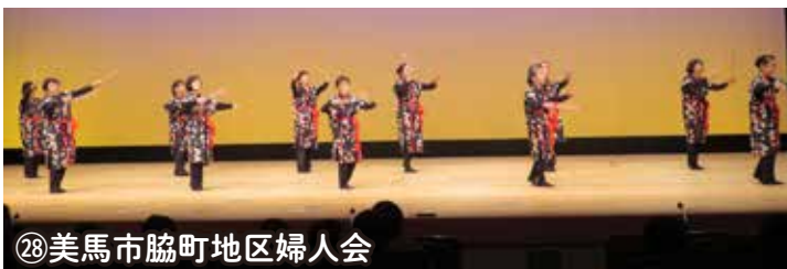
㉘美馬市脇町地区婦人会