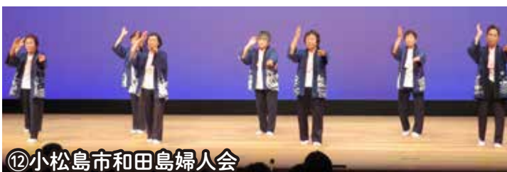
⑫小松島市和田島婦人会