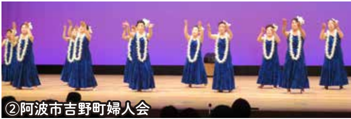
②阿波市吉野町婦人会