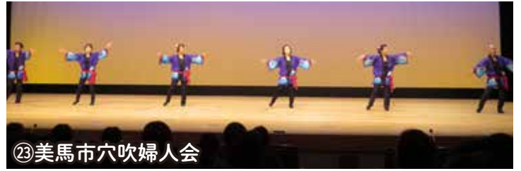
㉓美馬市穴吹婦人会