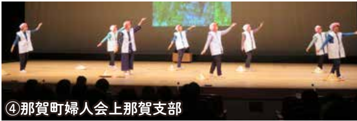
④那賀町婦人会上那賀支部