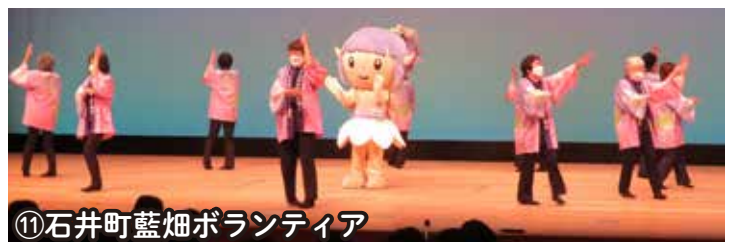
⑪石井町藍焔ボランティア