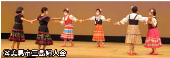
㉖美馬市三島婦人会