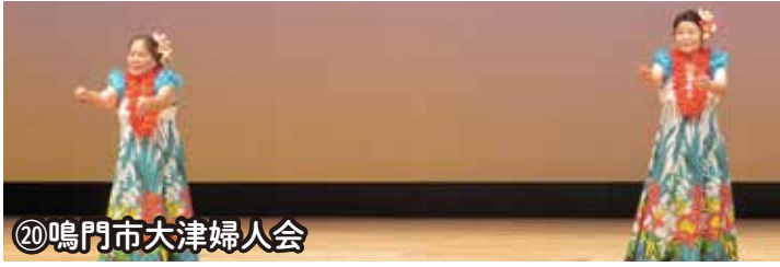
⑳鳴門市大津婦人会