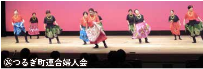
㉔つるぎ町連合婦人会