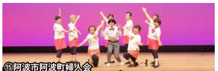
⑮阿波市阿波町婦人会