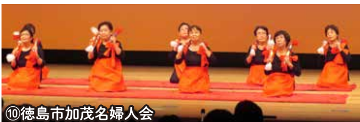
⑩徳島市加茂名婦人会