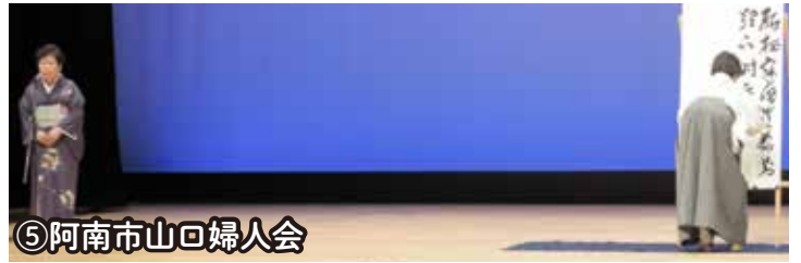
⑤阿南市山口婦人会