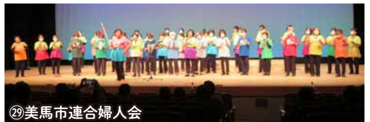
㉙美馬市連合婦人会