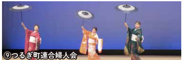
⑨つるぎ町連合婦人会