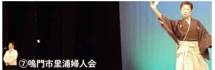
⑦鳴門市里浦婦人会