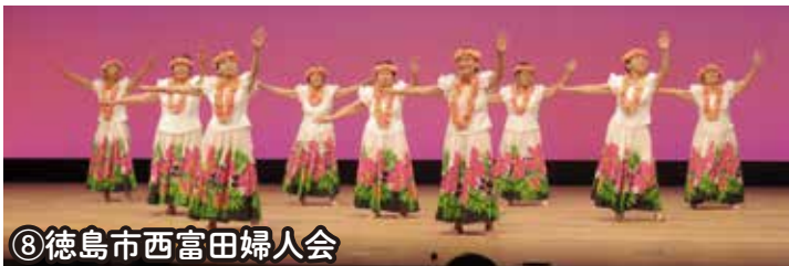
⑧徳島市西富田婦人会