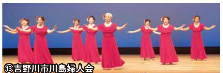
⑬吉野川市川島婦人会