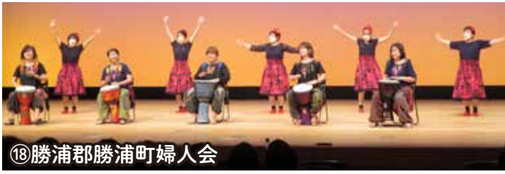
⑱勝浦郡勝浦町婦人会