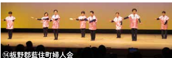
⑭板野郡藍住町婦人会