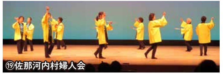
⑲佐那河内村婦人会