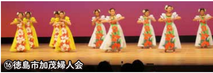
⑩徳島市加茂婦人会