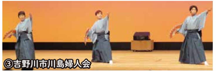
③吉野川市川島婦人会