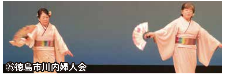
㉕徳島市川内婦人会