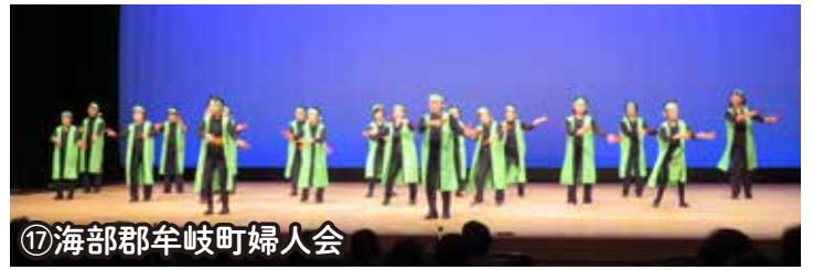
⑪海部郡牟岐町婦人会