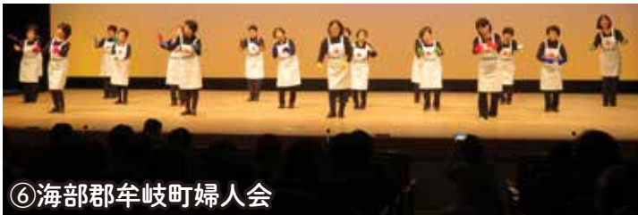
⑥海部郡牟岐町婦人会