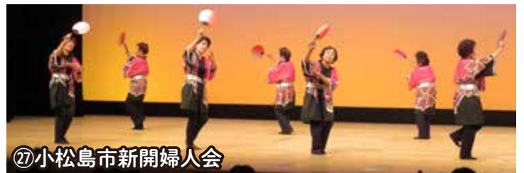
㉗小松島市新開婦人会