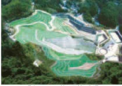
明和クリーン管理型処分場