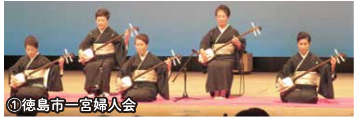
①徳島市一宮婦人会