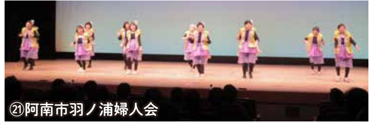
㉑阿南市羽ノ浦婦人会