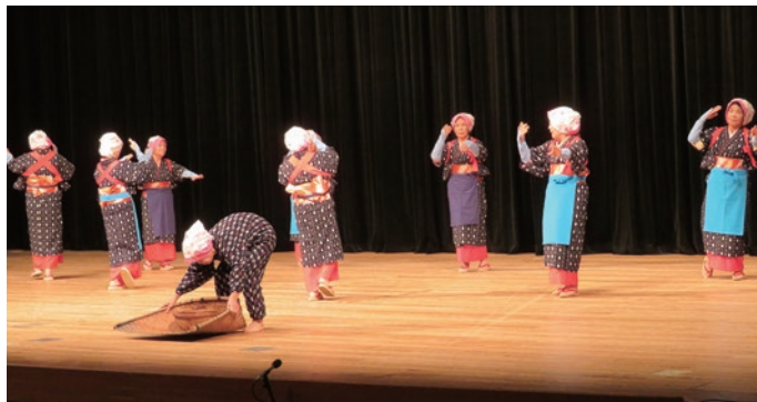
23. 三好市西祖谷連合婦人会