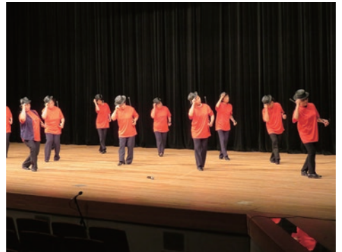
22. つるぎ町連合婦人会