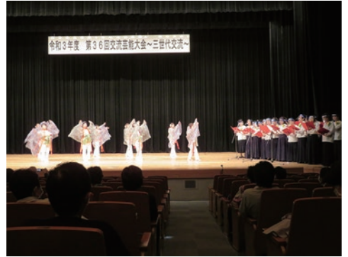
19. 美馬市脇町地区婦人会