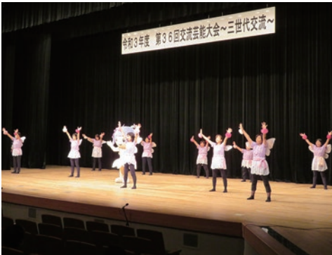
20. 石井町浦庄女性の会