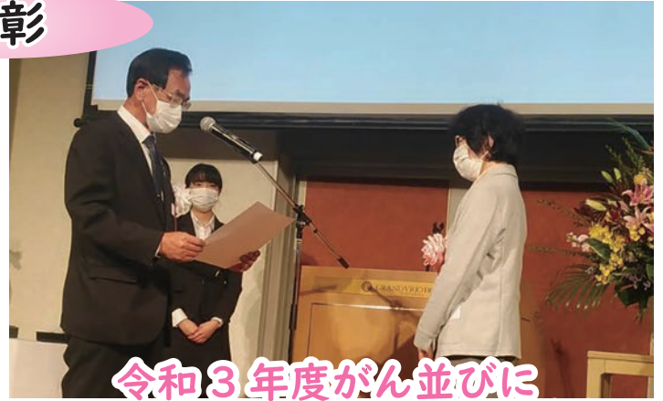
令和3年度がん並びに 結核予防対策功労者理事長表彰

地域における社会教育活動を推進するために、多年にわたり社会教育の振興に功労があった者