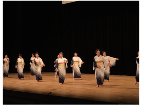
16. 板野郡藍住町婦人会