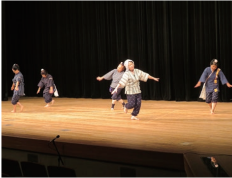
18. 阿波市土成町婦人会