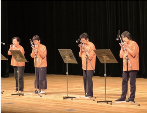
17. 海部郡美波町婦人会