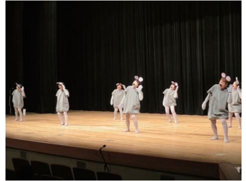
9. 鳴門市木津婦人会