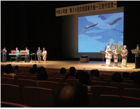
1. 阿南市桑野婦人会