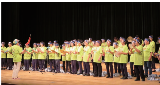
25. 美馬市連合婦人会