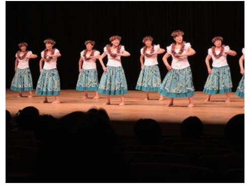
3. 徳島市加茂婦人会