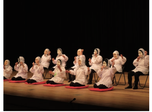
6. 吉野川市川田中部婦人会