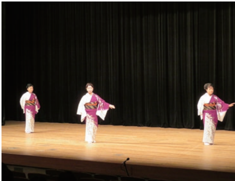
21. 小松島市櫛淵婦人会