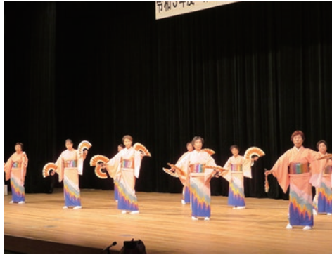
8. 小松島市立江婦人会