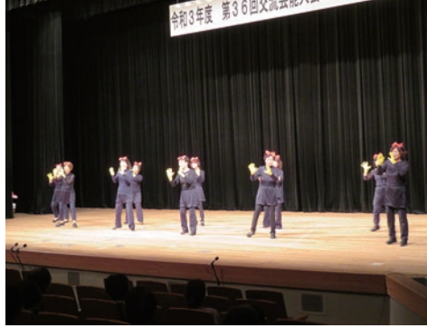
5. 美馬市美馬地区婦人会