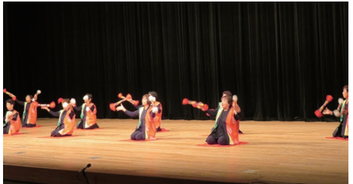
11. 海部郡美波町婦人会