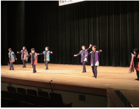
15. 阿南市富岡婦人会