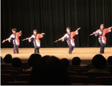
4. 鳴門市北灘婦人会