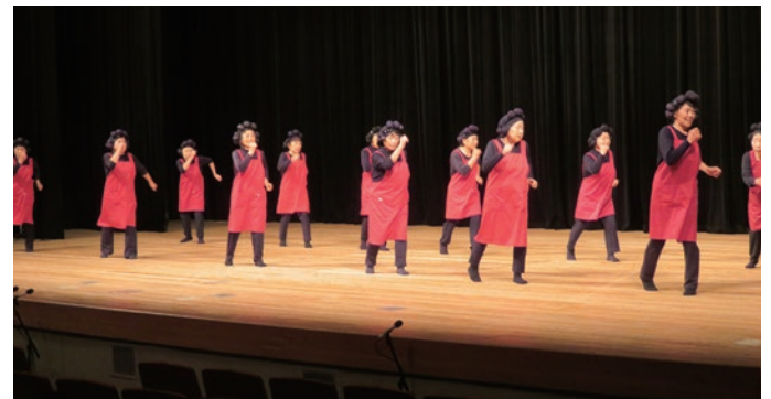
24. 吉野川市山瀬婦人会