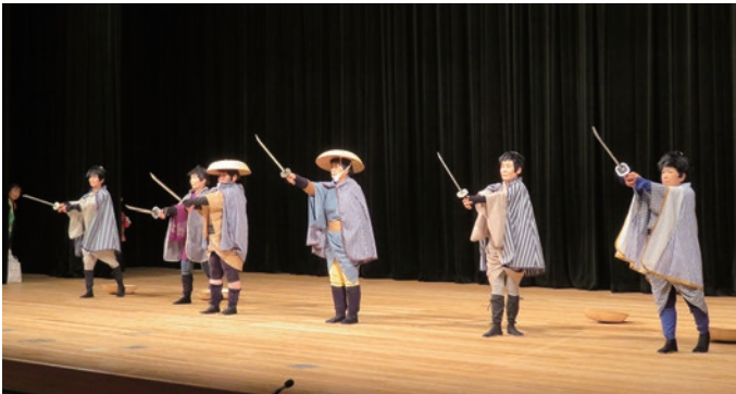
10. 那賀町相生支部婦人会