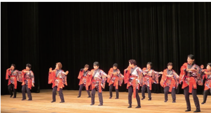
12. 吉野川市山瀬婦人会