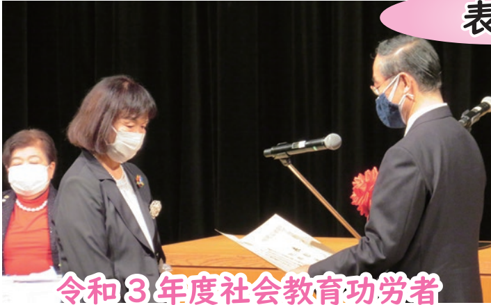
令和3年度社会教育功労者 文部科学大臣表彰